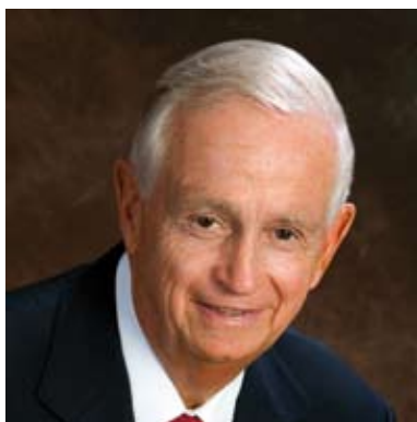
J.W. "Bill" Marriott jr., styreleder og adm.dirktør

KLP valgte å ta hotellkjeden Marriott International tilbake i sin investeringsportefølje etter at selskapet ble ekskludert i 2002. Dette viser at et langsiktig press fra investorer skaper positive resultater.